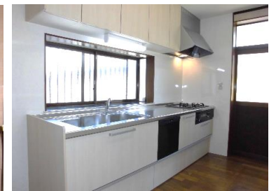
キッチン(食洗器付き)

岐阜県知事免許(5)第3894号 (社)岐阜県宅地建物取引業協会会員 東海不動産公正取引協議会加盟