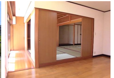
リビング+和室+広縁