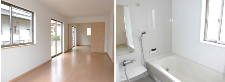
リビング + 洋室 浴室