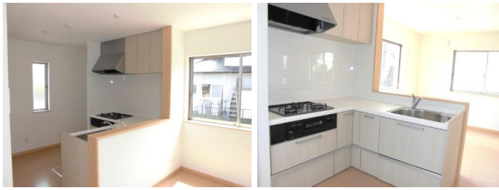
D K L型キッチン