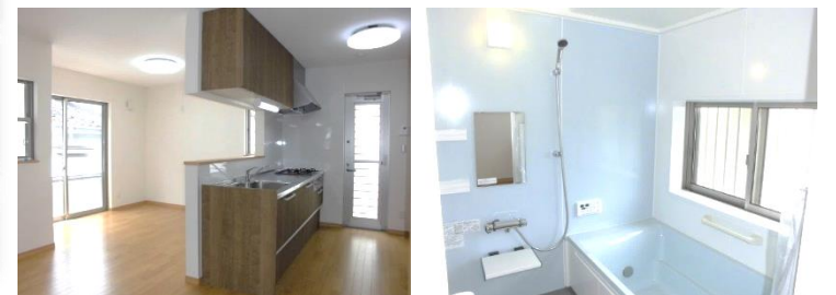
ダイニングキッチン