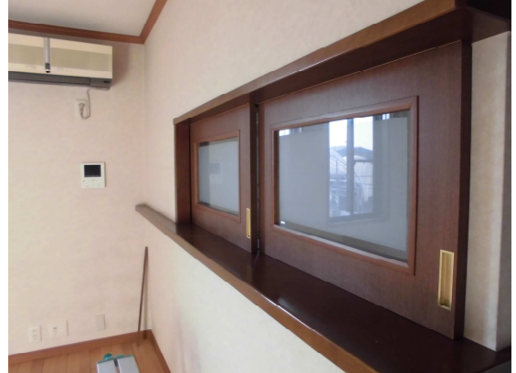
1階LDK: おしゃれなカウンターあります!