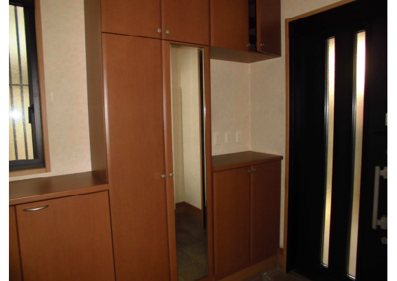
玄関: 外出前に鏡で全身をチェック!

岐阜県知事免許(5)第3894号 (社)岐阜県宅地建物取引業協会会員 東海不動産公正取引協議会加盟