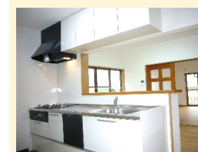
キッチン(食洗器付き)