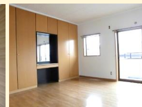
2階 洋室(ドレッサー付き)