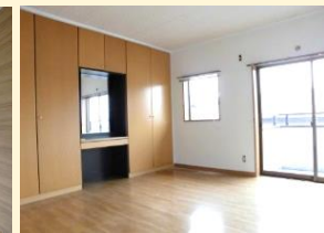
2階 洋室 (ドレッサー付き)

株式会社 早川不動産 本店 ☎0574-62-6344 住所: 岐阜県可児市下恵土5487番地3