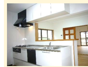
キッチン(食洗器付き)