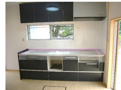
キッチン(食洗器付き)